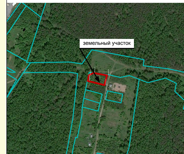
Чертёж градостроительного плана земельного участка по адресу: Челябинская область, г. Златоуст, кв-л Архангельский, 35

Граница 3 пояса зоны санитарной охраны скважины № 14-20/Б